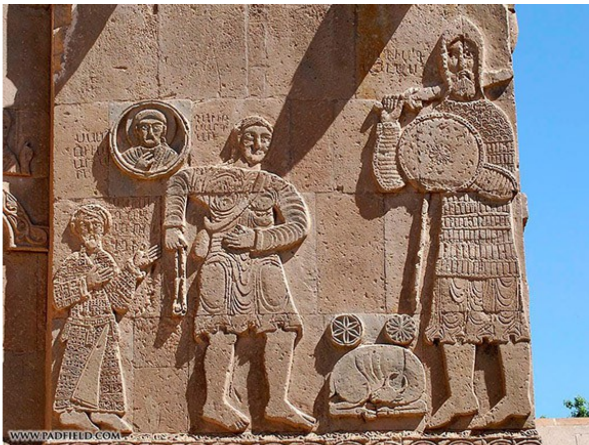
Bas-relief de l'église arménienne de Sainte-Croix d'Aghtamar, située en Turquie et construite au X eme siècle. Il représente David à gauche et Goliath, à droite.