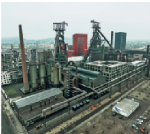
A. CS&I luxembourgeois: Belval, nouveau quartier d'Esch-sur-Alzette Vue sur la « Cité des sciences » intégrant deux anciens hauts fourneaux, la tour rouge de la banque Dexia, la tour grise de l'université de Luxembourg. Lancée dès les années 1990, la reconversion du plus grand site sidérurgique luxembourgeois crée un nouveau pôle dynamique au Sud du Grand-Duché.