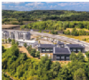
B. Cité française sur les débris en construction sur la friche sidérurgique de Micherville. Au premier plan, ancien laboratoire de fusée reconverti en bâtiment à énergie positive, abritant la Communauté de communes. Lancé en 2009, le projet (1900 logements, bureaux, équipements commerciaux, culturels et sportifs, résidences universitaires) veut profiter de la dynamique de Belval pour reconstruire les friches industrielles du Nord-Lorrain.

Belval, le nom donné à cette cité des sciences située à moins d'un kilomètre de la frontière française, a de grandes ambitions. Elle incarne la volonté du pays de ne plus s'appuyer uniquement sur sa puissance financière, mais également sur le savoir et l'innovation. Le site doit aussi permettre de revitaliser cette région dévastée par la fin de la sidérurgie, et désengorger la capitale, à 20 kilomètres au nord. Pour cela, le Luxembourg a mis les moyens : le pays a investi 950 millions d'euros pour aménager Belval, qui accueille aussi des centres de recherche, des start-up et