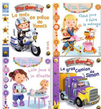
Document 1 : Des attitudes intériorisées dès l'enfance

► Consigne : Analysez les documents suivants proposés par le manuel numérique du Livre scolaire puis réalisez un enregistrement vocal sur l'ENT faisant le point sur les discriminations dont les femmes sont victimes en France (nature, facteurs explicatifs) et les moyens mis en œuvre pour lutter contre ces dernières.