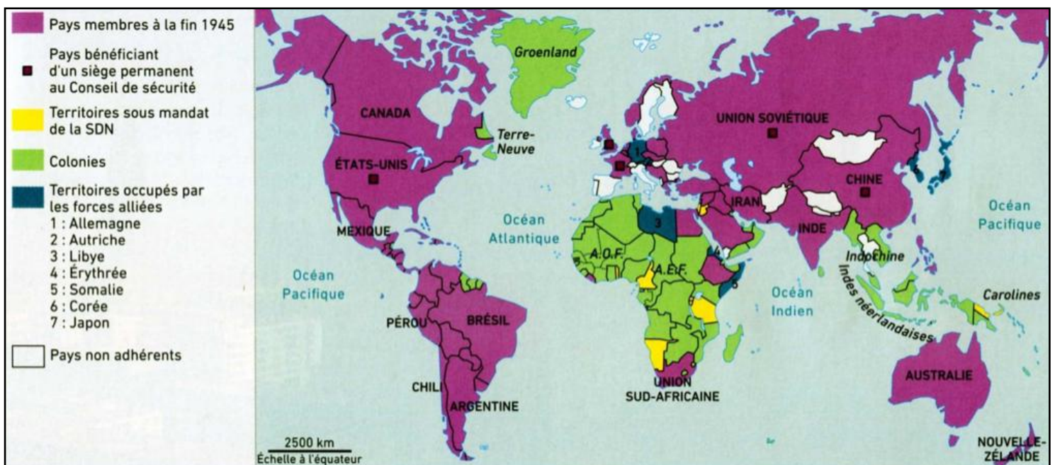
DOCUMENT 4 - Membres et non-membres de l'ONU en 1945

6/ Pour quelle raison certains pays européens et asiatiques ne sont pas membres de l'ONU à sa fondation ?