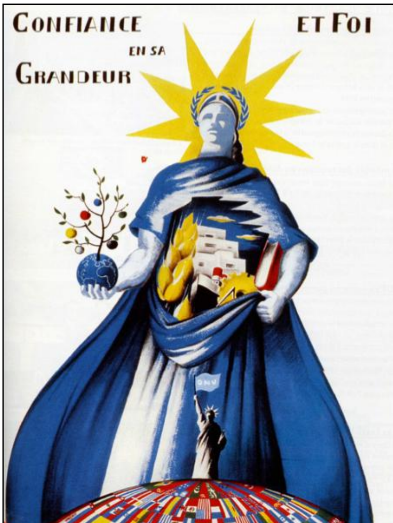
DOCUMENT 3 - Affiche pour la création de l'ONU, 1945

3/ Comment expliquer que les États-Unis jouent un rôle important dans la création de l'ONU ?