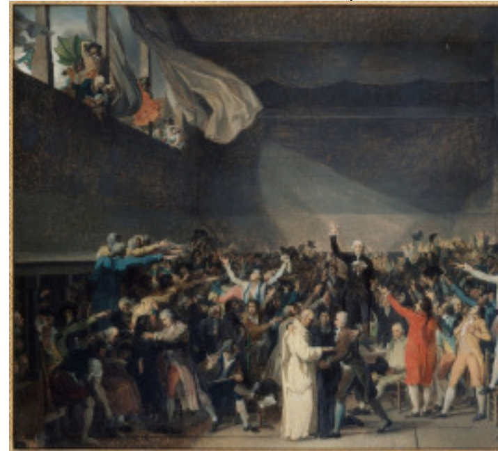
20 juin: demande de constitution 14 juillet: prise de la Bastille Le roi Louis XVI accepte de partager son pouvoir 4 aout: abolition des privilèges 26 aout: DDHC