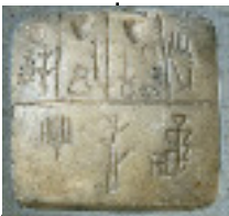
Invention de l'écriture 4000 av J.C.