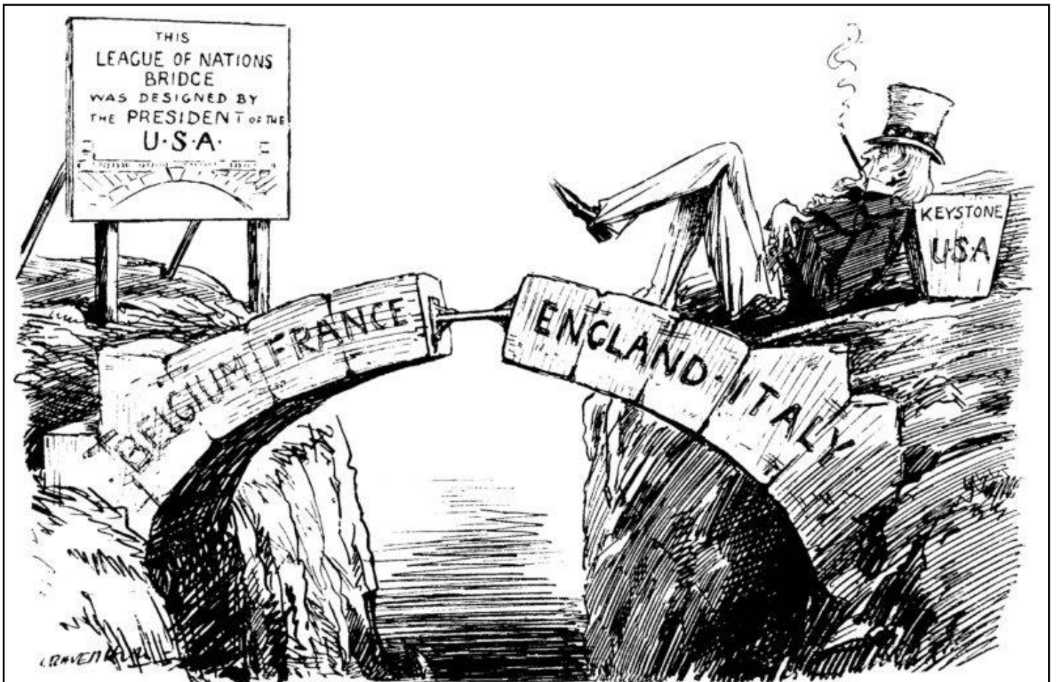
« Ce pont de la Société des Nations a été conçu par le Président des États-Unis » dessin publié dans Punch Magazine , 10 décembre 1919