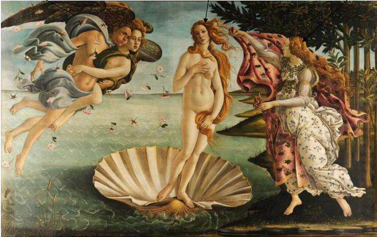
La naissance de Vénus par Botticelli en 1482 (15 ième siècle)

Vénus est la déesse de l'amour et de la beauté dans la mythologie , fille du dieu du ciel et de la mer.