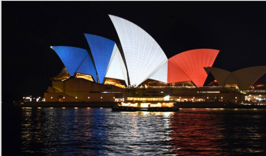
Le théâtre de Sidney