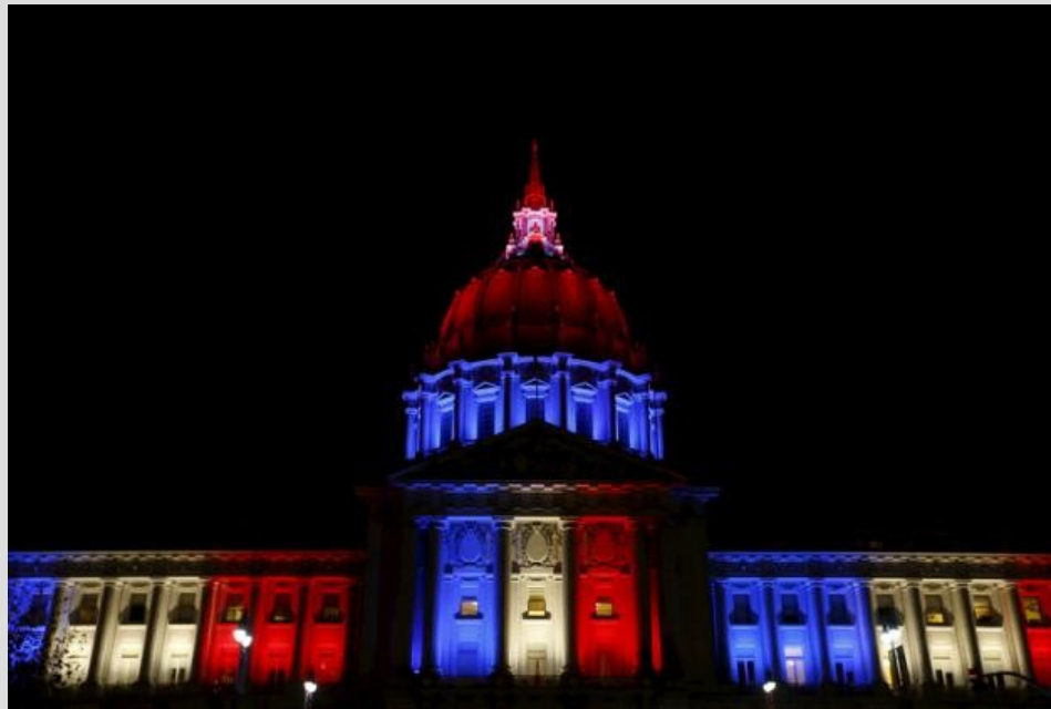
L'Hotel de ville de San Francisco