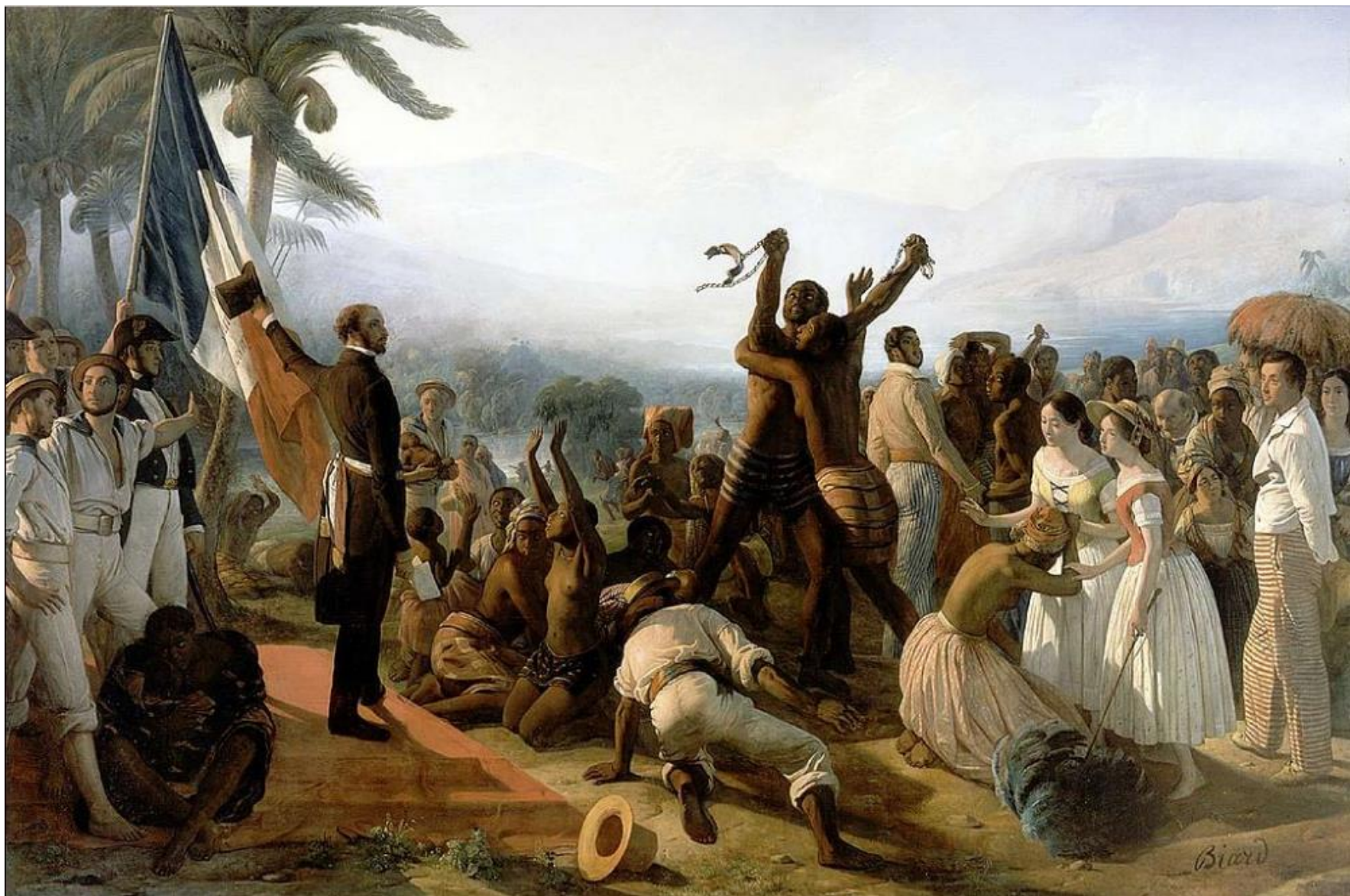
Document 8 : L'abolition de l'esclavage (1849), tableau de François-Auguste Biard