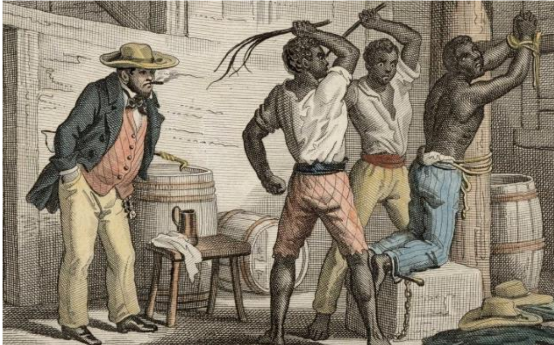
Document 3 : Scène de punition d'un esclave, gravure anonyme du XIX e siècle