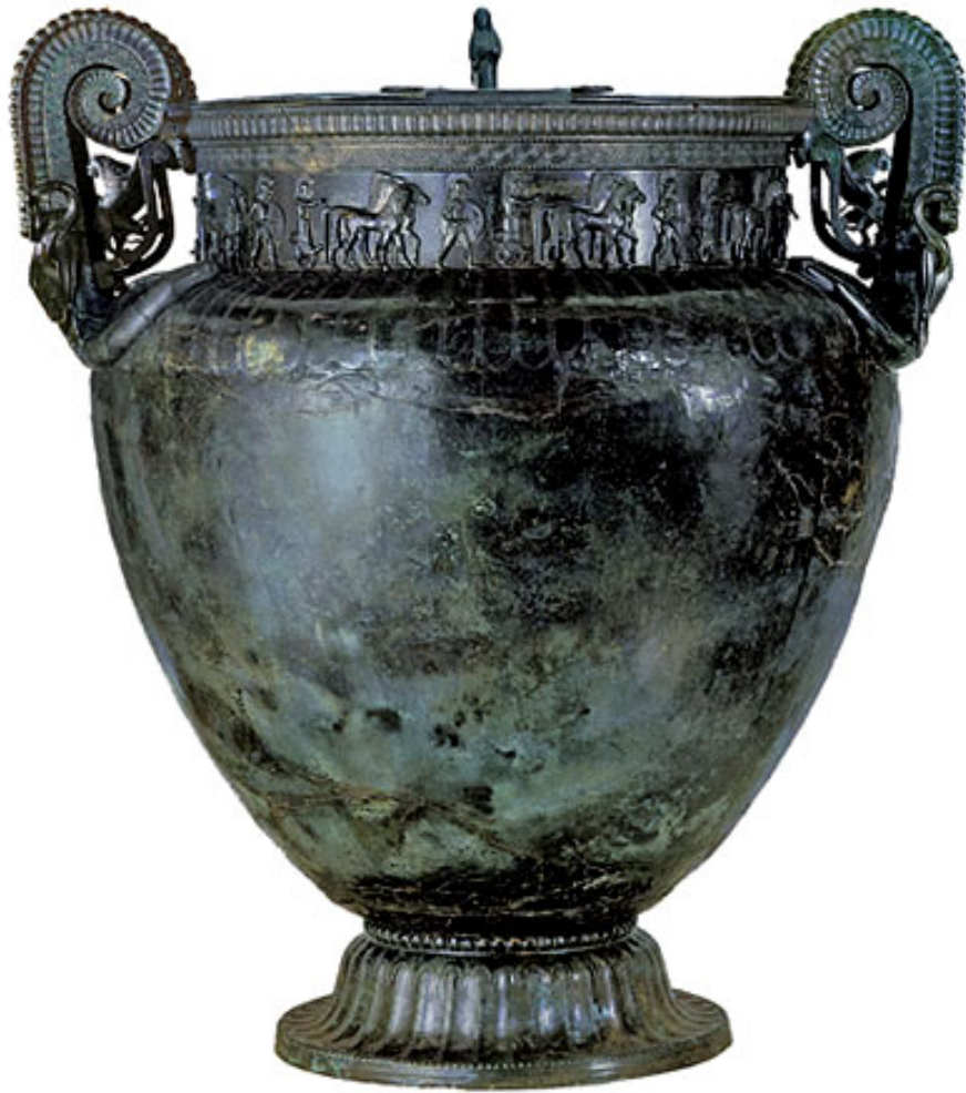
Vase de Vix