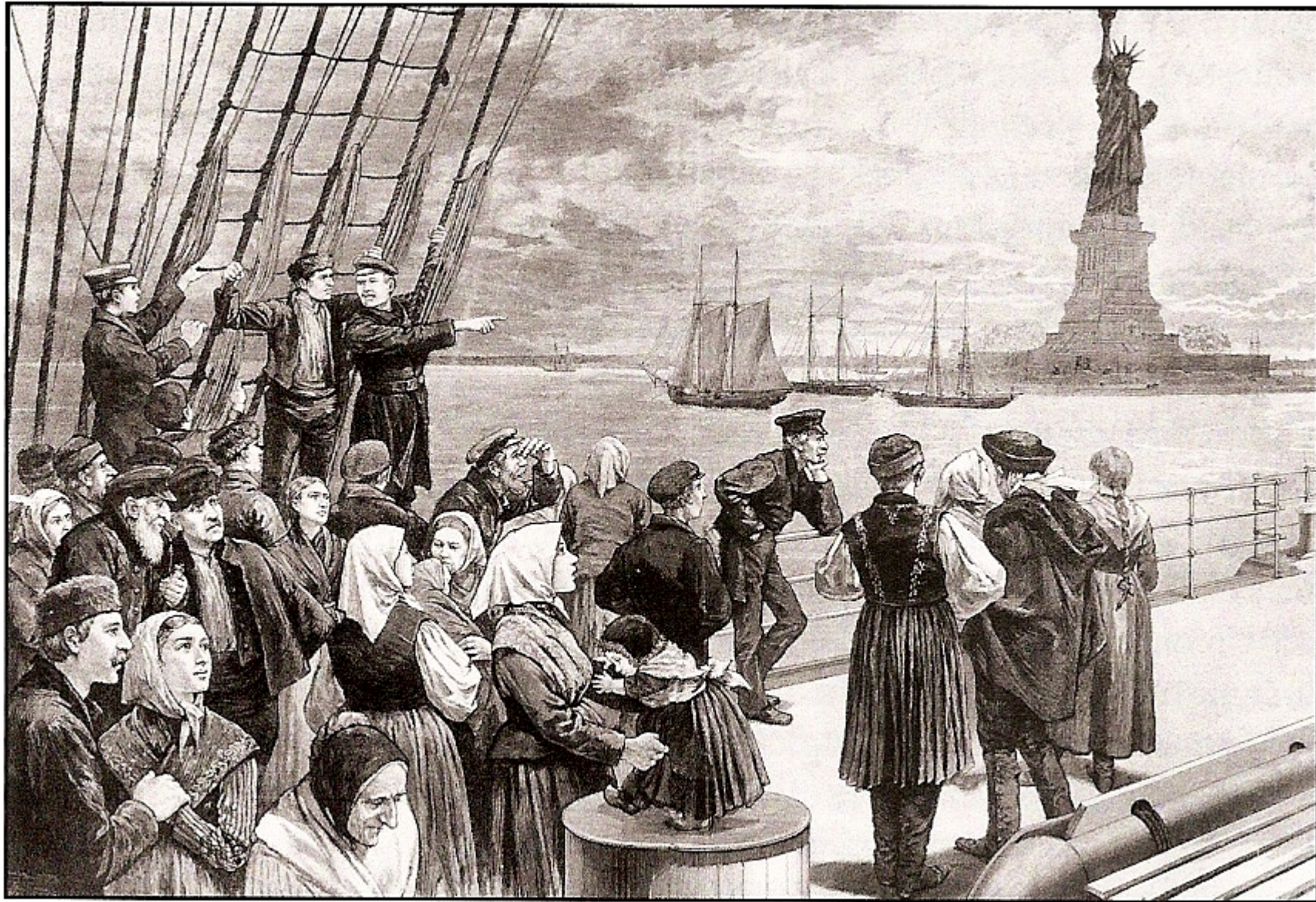
Arrivée des migrants aux États-unis, gravure publiée en 1887 dans Frank Lestie's illustrated (Documentation photographique n°8063)